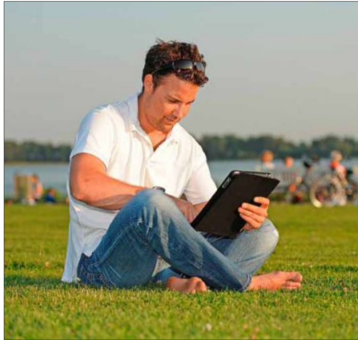
In der Pause oder im Urlaub schnell mit einem Klick bewerben.

Die Bewerbung hat nur Aussicht auf Erfolg, wenn das Profil aktuell