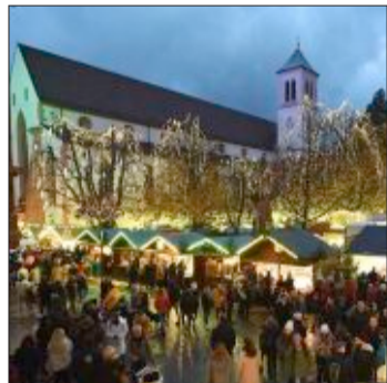
Bilder der Region: Lichterbaum in Basel, SC und Freiburger Weihnachtsmarkt vor der Martinskirche