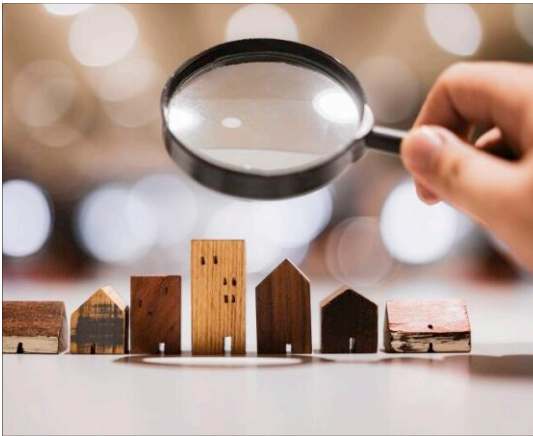
Augen auf: Die Wohnungssuche ist schwierig, stellt aber für viele kein Hindernis dar.

Ein Problem auch: Wer vor zwei Jahren noch zu einem oder anderthalb Prozent einen Kredit abschließen und so günstig finanzieren konnte, der muss bis zu 3,5 und 4,5 Prozent entrichten, wie die hiesigen Finanzinstitute einräumen. Die Konsequenz: „Der Neubaubereich ist inzwischen fast