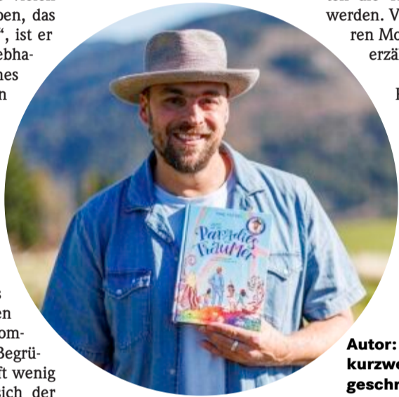
Autor: Max Mutzke hat ein kurzweiliges Kinderbuch geschrieben.

Sänger mit seinen Kindern im Traum, weil nur wer schläft, auch die Abenteuer im paradiesischen Traumland erleben kann. Da gibt es einen Wunschsprungfelsen,