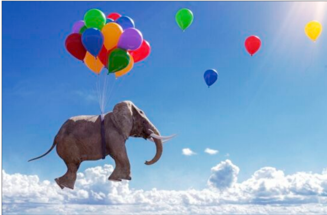
Sich ganz leicht fühlen – Glücksgefühle gibt's in Südbaden bei vielen Menschen.

Die Natur lockt zum Wandern und Mountainbiken und ist ein Er-