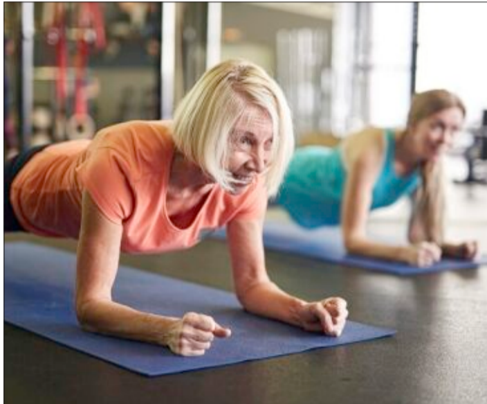
Sport und Fitness sind ein wichtiger Benefit-Sektor.

Hinzu komme, dass die dabei anfallenden Corporate-Benefits-Kosten sich in vielen Fällen von der Steuer absetzen lassen. Auch wegen dieser Förderung durch den Fiskus hat sich zum Thema Arbeitgeber-Benefits in den vergangenen Jahren ein eigener Markt an diversen Service-Angeboten entwickelt, welche Unternehmen die Handhabung erleichtern sollen. Da gibt es beispielsweise Programme und Apps fürs Gesundheitsmanagement, für die betriebliche Verpflegung oder die Mobilität, All-inklusive-Angebote