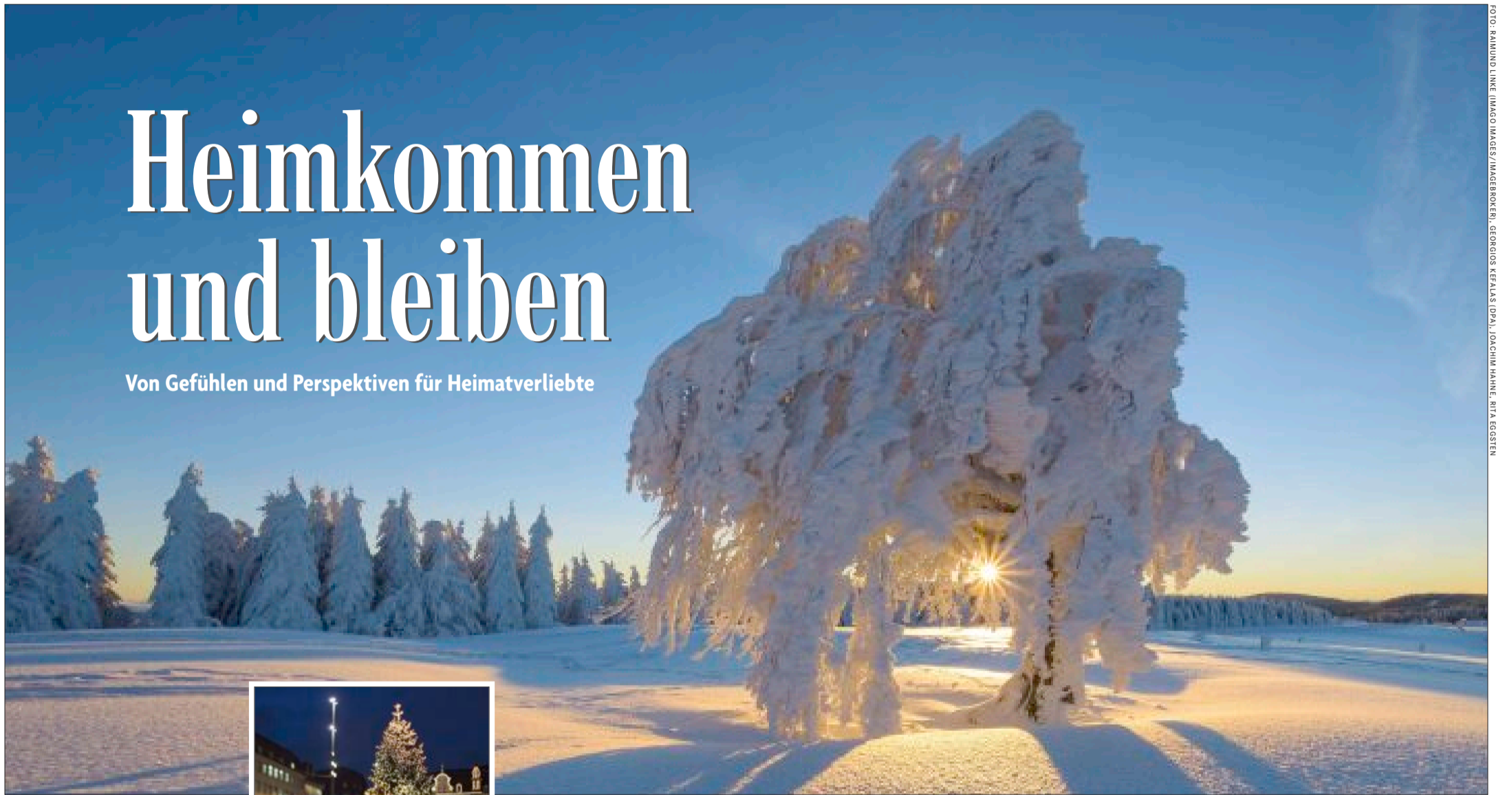
Die Wetterbuchen am Schauinsland sind fast schon so etwas wie ein Symbol für den Freiburger Hausberg.

Von Gefühlen und Perspektiven für Heimatverliebte