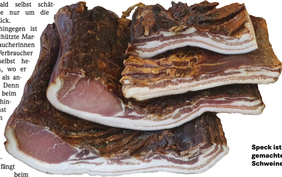
Speck ist haltbar gemachtes rohes Schweinefleisch.

Aus dem einstigen Kalorienlieferant armer Waldbauern ist längst ein Stammgast alltäglicher und auch gehobener Küche geworden: Etwa als Mantel feiner Kalbsbrust, als Würste und Beilage in Suppen