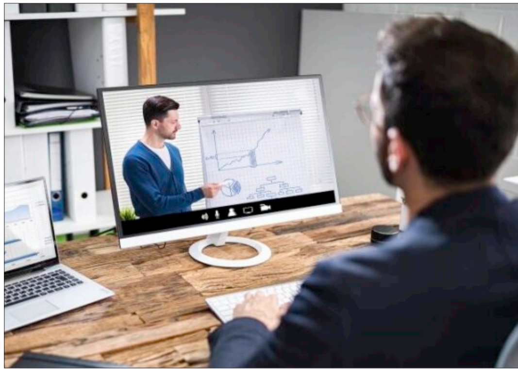
Weiterbildung ist auch vor dem Hintergrund des Strukturwandels immer wichtiger.

Merk: Vor dem Hintergrund des anstehenden Strukturwandels wird das Thema Weiterbildung immer wichtiger. Noch immer verfügen über 40.000 Beschäftigte im Agenturbezirk über keinen Berufsabschluss. Wenn im vergangenen Jahr lediglich 200 Beschäftigte eine über das Qualifizierungschancengesetz geförderte Weiterbildung begonnen haben, zeigt das: Hier geht noch deutlich mehr. Nicht zu unterschätzen ist das Thema Inklusion. Aus vielen