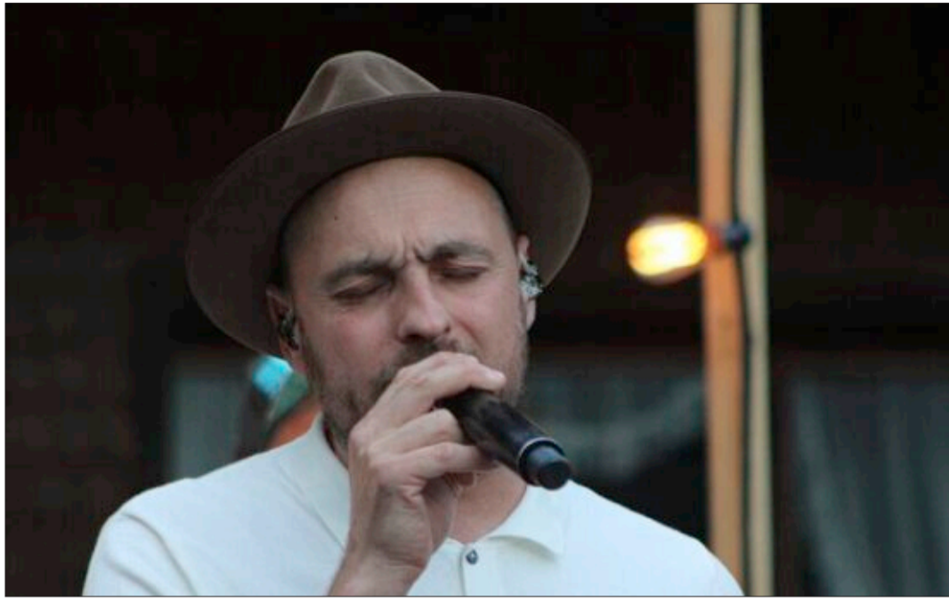
Musiker und Sänger: Max Mutzke tritt auch immer wieder in der Region auf – im vergangenen Jahr bei Stimmen in Lörrach oder bei einem Bauernhofkonzert im Dreisamtal (Foto).

Apropos träumen. Darum dreht sich fast alles auch im Kinderbuch von Max Mutzke. Sie erinnern sich? Das war das mit der überschwänglichen Begrüßung beim Heimkommen. Weil zwischen dem Begrüßen und ins Bett gehen oft wenig Zeit blieb, verabredete sich der