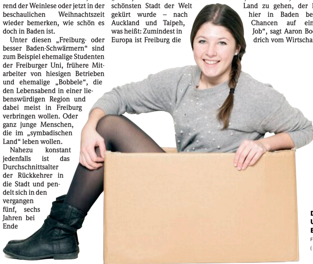
Die Kisten für den Umzug zurück nach Baden sind gepackt.