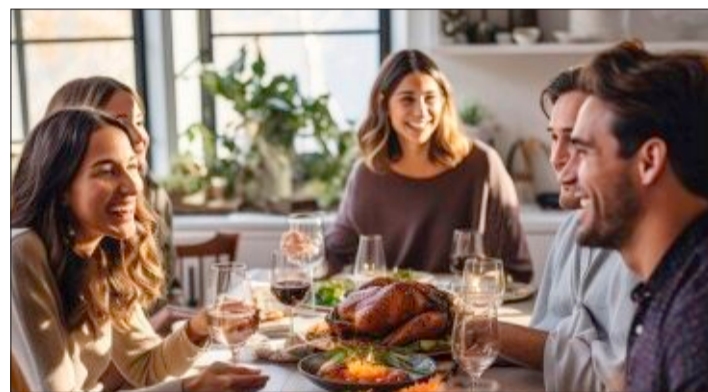
Frohe Weihnachten: Für die meisten Menschen bedeutet das vor allem, die Familie zu sehen.

se Art der Nostalgie und noch etwas: Die Heimatverliebtheit wächst wieder. So stark, dass der Gedanke reift, wieder ganz zurückzukehren.