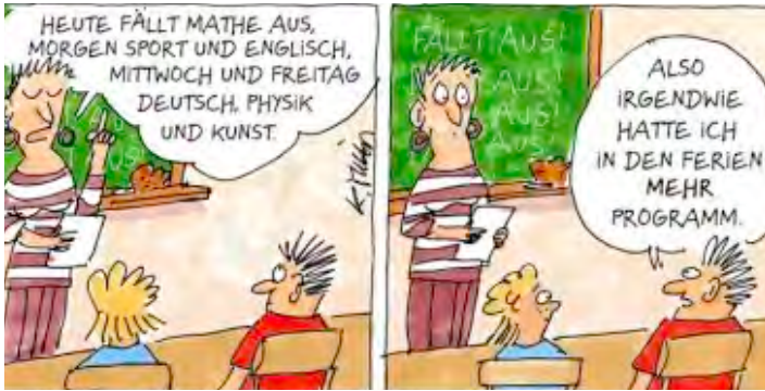
CARTOON: KARIN MIHM