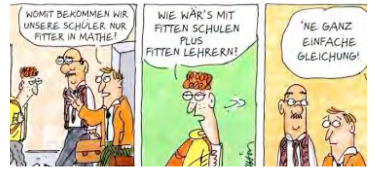
CARTOON: KARIN MIHM

Auch der Ausbildungsverdienst spricht für sich und beträgt je nach Bundesland im ersten Ausbildungsjahr 880 bis 934 Euro, im zweiten 1095 bis 1230 Euro und im dritten Ausbildungsjahr zwischen 1305 bis zu 1495 Euro netto pro Monat.