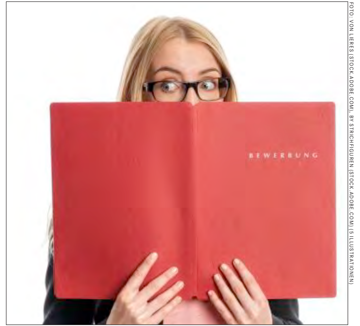
Bloß nicht verstecken: Mit diesen Tipps kommt man angstfrei durchs Bewerbungsgespräch.

bekommen müssen, sondern dass auch Sie sich ein Bild von dem Arbeitgeber machen können. „Sie wählen den Arbeitgeber ja auch aus und gehen nicht wie das Lamm zur Schlachtbank“, so Leitner. Arbeitgeber und Arbeitnehmer sind im Prinzip Partner, wie bei einer Beziehung. „Das muss für beide funktionieren.“