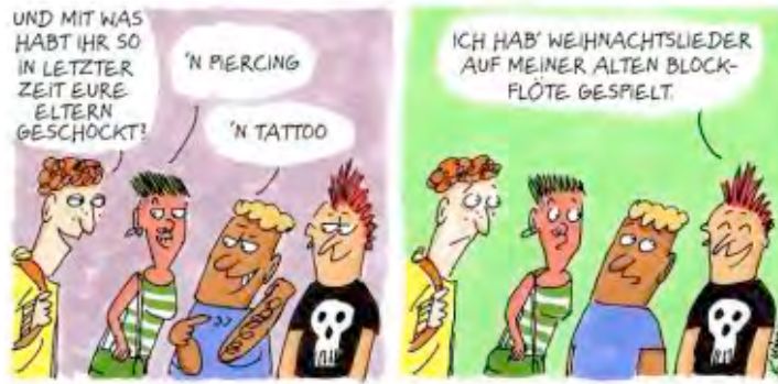
CARTOON: KARIN MIHM