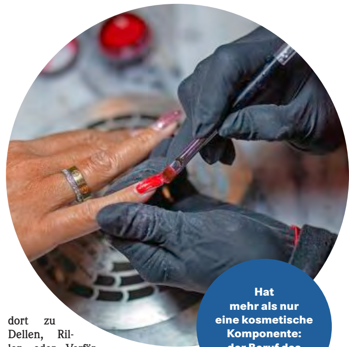
NEGI LUMINOS INDUSTRIES/BOLO

Wir bekommen zu hören, dass man uns nicht brauchen würde. Das ist zu kurz gedacht, denn es geht um weit mehr, als nur darum, Nägel zu verschönern oder zu pflegen: Zu uns kommen etwa Brustkrebspatientinnen, damit ihnen im Zuge der Chemotherapie nicht die Fingernägel brechen oder es