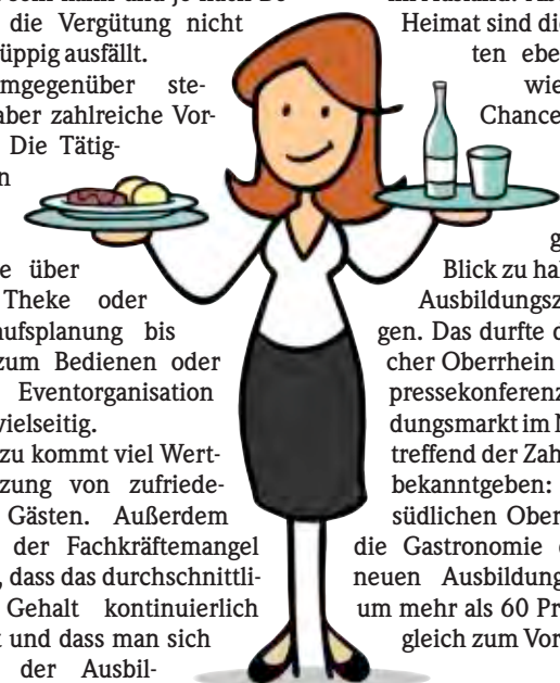
CARTOON: ROBERT ANESCHKE

Das scheinen immer mehr Jugendliche im Blick zu haben, denn die Ausbildungszahlen steigen. Das durfte die IHK Südtlicher Oberrhein in der Bilanzpressekonferenz zum Ausbildungsmarkt im November be-treffend der Zahlen von 2023 bekanntgeben: Alleine im südlichen Oberrhein konnte die Gastronomie die Zahl der neuen Ausstellungsverhältnisse um mehr als 60 Prozent im Vergleich zum Vorjahr steigern.