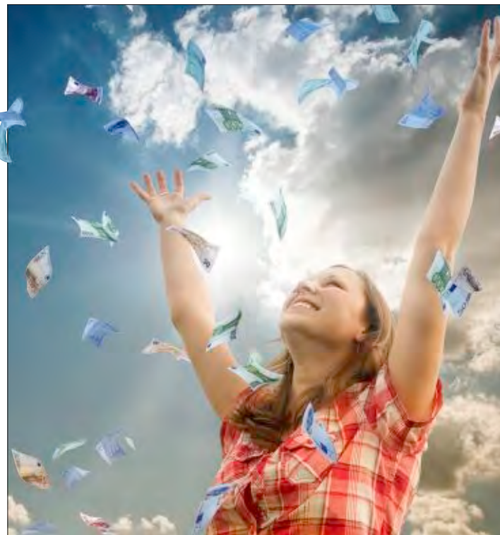
Endlich ist es so weit: Es regnet das erste eigene Geeeeeeeld!