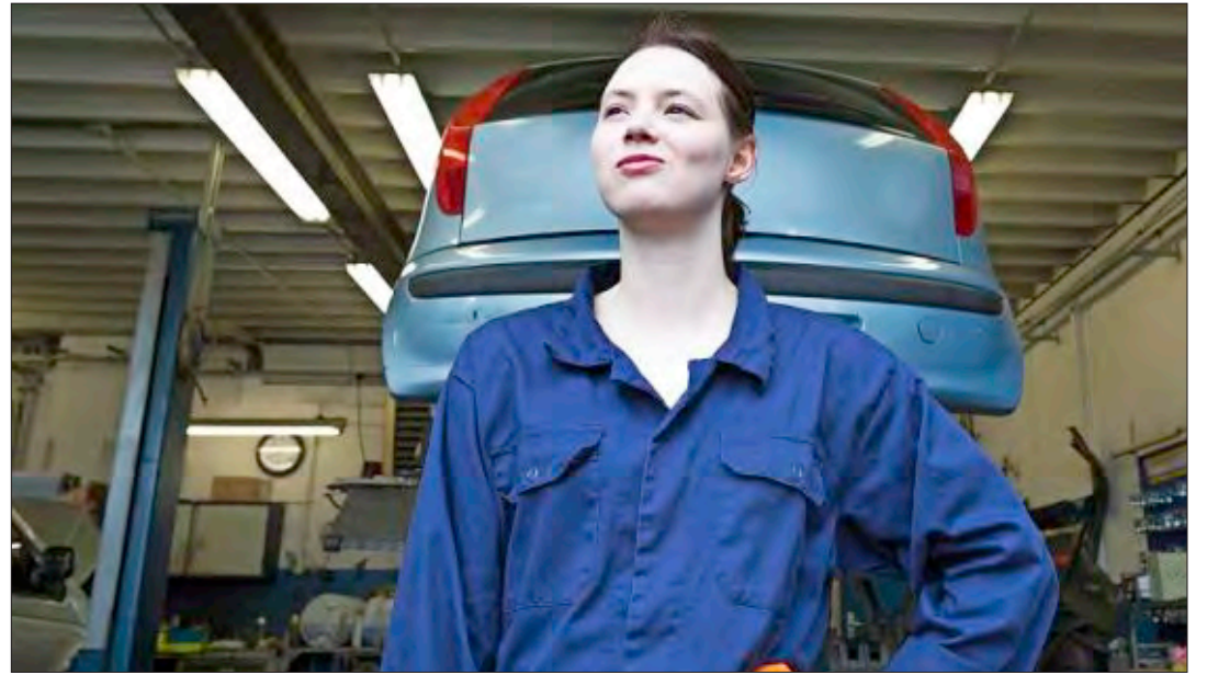
Mehr Freizeit: Auch Azubis, die ihre Ausbildung schon begonnen haben, können Stunden reduzieren – wenn der Ausbildungsbetrieb einverstanden ist.

Schmachtel: Eine Ausbildung in Teilzeit ist eine Vereinbarung zwischen Arbeitgeber und Arbeitnehmer. Sind sie sich einig, können