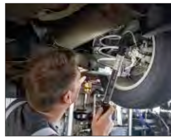
Der Azubi bekam Recht.

rifvertrag enthaltenen Vergütungen um mehr als 20 Prozent unterschreitet. Deshalb verlangte der Kfz-Mechatroniker-Azubi vom Arbeitgeber eine Nachzahlung. Während seiner Ausbildung bekam er 2018 im ersten Lehrjahr 450 Euro brutto monatlich und im letzten (2021) 600 Euro. Der Azubi gab an, dass dieser Lohn 80 Prozent der tariflich vorgesehenen Vergütung unterschreite. Das Gericht entschied zugunsten des