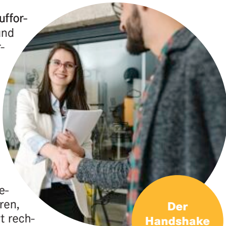
Der Handshake zum Erfolg