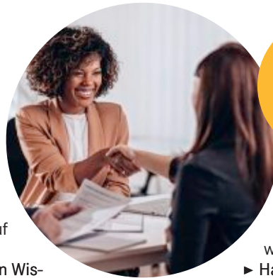
Der Handshake zum Erfolg

tens hat dein Gesprächspartner schon viele Bewerbungsgespräche geführt und merkt, wenn du dich verstellst.