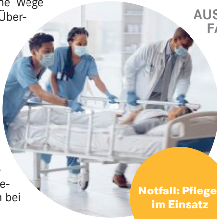
Notfall: Pfleger im Einsatz

Hilfskräfte helfen Pflegebedürftigen beim Aufstehen, begleiten sie zur Toilette und helfen auf Stationen im Krankenhaus bei der Essensverteilung. Hilfskräfte arbeiten in Krankenhäusern sowie in Pflege- und Altenheimen, aber auch bei ambulanten Pflegediensten.