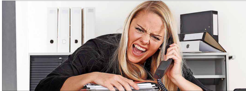
Neeeeeeiiiiiiii, nicht schon wieder eine Absage – um das zu verhindern, sollten Jugendliche auch überregional suchen.