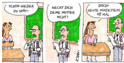
ZEICHNUNG: KARIN MIHM