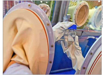
Auch die chemische Industrie ist ein Berufsfeld, in dem junge Fachleute gute Gehälter erwarten können.