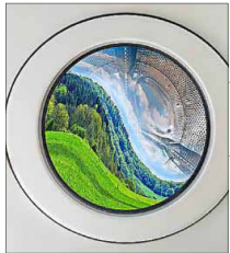
Greenwashing gibt's auch bei vermeintlich grünen Berufen.

„Kluge Unternehmen lassen sich auch treiben von den Beschäftigten und fragen, was ihnen wichtig ist“, sagt der Projektleiter. So habe jeder die Möglichkeit, selber Ideen einzubringen und dafür zu sorgen, dass der eigene Arbeitgeber ein Stück grüner wird. tmm