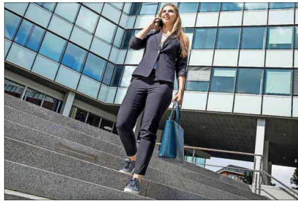
Mehr Geld, aber oft steile Hierarchien gibt's in Großbetrieben.

Ob kleines Familienunternehmen, traditionsreicher Mittelständler oder international agierender Großkonzern: Für Beschäftigte gibt es verschiedene Strukturen, Werte und Leitlinien. Es lohnt sich, bei der Stellensuche zu überlegen, wozu man passt – und sich dazu einige Fragen zu stellen.