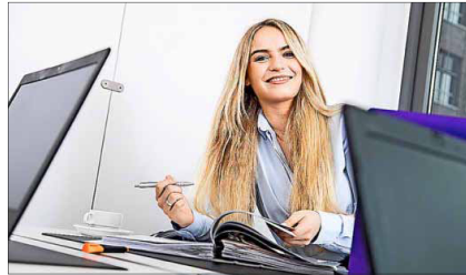
Angepasste Verordnung bei den Versicherungskaufleuten