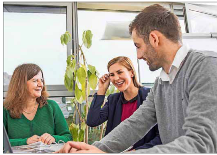
Wer offen und neugierig auf das neue Team zugeht, wird meist herzlich aufgenommen.