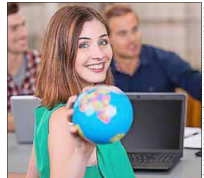
Die Welt ruft.

Dazu sollte man das Thema beim Betrieb offen und interessiert ansprechen, rät Berthold Hübers, stellvertretender Geschäftsführer der Nationalen Agentur Bildung für Europa beim Bundesinstitut für Berufsbildung (NA BIBB) in dem Beitrag. Am besten stellt man die Vorteile für das Unternehmen heraus: Etwa, dass man im Ausland neue Dinge lernt, die man mit in den Betrieb bringt. tmn