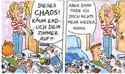
ZEICHNUNG: KARIN MIHM