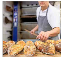
Bäcker sein wie Papa? Oft ist die Erwartungshaltung groß.

ten. Hinzu kommt: Die Arbeit und das berufliche Umfeld der Eltern sind Kindern in der Regel vertraut, mit allen Licht- und Schattenseiten. Kontakte und Netzwerke der Eltern können außerdem Türöffner sein. Nichtsdestotrotz erlebe