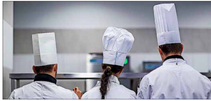
Angehende Köche können veganes Kochen vertiefen. Unterstützt werden sie von den neuen „Fachkräften Küche“.