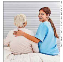
In der Pflege gibt es nun auch duale Studiengänge.

Genauso gilt seit Anfang 2020: Wer Hebammen werden will, muss ein Studium absolvieren. Das duale Bachelorstudium heißt Hebammenkunde oder angewandte Hebammenwissenschaft. Hintergrund der vielen Neuerungen ist laut Pompe vor allem das Ziel, die Pflegeberufe aufzuwerten und an moderne Anforderungen anzupassen. tmn