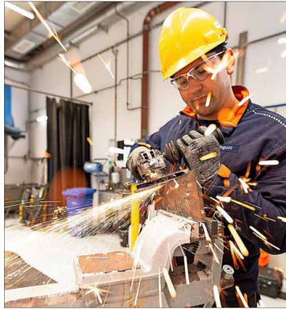
Hier ist der Funke übersprungen: Mechatroniker durchlaufen eine abwechslungsreiche Ausbildung.

Jugendliche sind gut beraten, schon bei der Wahl des Ausbildungsbetriebs ein Unternehmen zu finden, das den eigenen Inter-