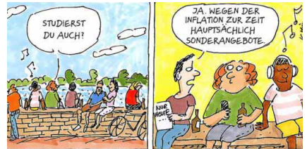
ZEICHNUNG: KARIN MIHM

Wichtig ist laut Expertin Struss jedoch, dass man eine Balance findet – das heißt, dass man seine Erfolge auch selbst wahrnimmt, und mit seiner Arbeit und sich selbst insgesamt zufrieden ist. Und nicht nur nach Fehlern sucht. tmn