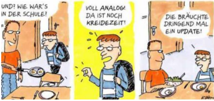
ZEICHNUNG: KARIN MIHM