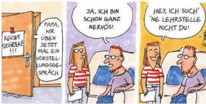
ZEICHNUNG: KARIN MIHM