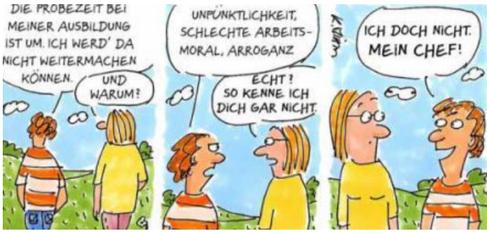
ZEICHNUNG: KARIN MIHM