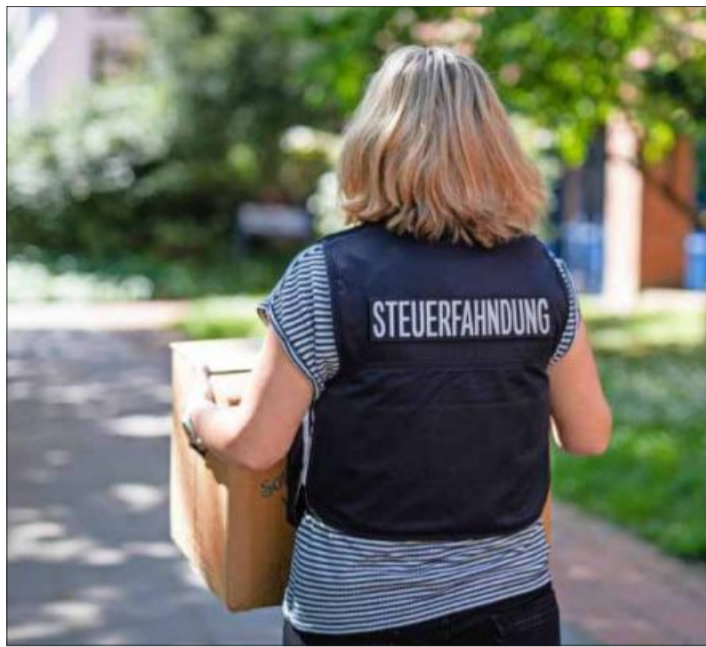
Bei Durchsuchungen stellen die Fachleute beispielsweise Ordner, E-Mails und andere Beweisunterlagen sicher.

Für eine unangekündigte Durchsuchung muss das zuständige Amtsgericht einen Durchsuchungsbeschluss ausstellen. Bei einer Durchsuchung beschlagnahmen wir gegebenenfalls Beweismaterial. Das können zum Beispiel Aktenordner mit Unterlagen oder E-Mails sein. Dieses Beweismate-