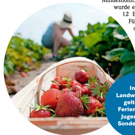
In der Landwirtschaft gelten bei Ferienjobs für Jugendliche Sonderregeln.

► Bezahlung: Das Mindestlohngesetz gilt auch für Ferienarbeit, allerdings haben nur Jugendliche ab 18 Jahren den Anspruch auf den Mindestlohn. Im Juni 2022 wurde eine Erhöhung auf 12 Euro beschlossen. Für unter 18-Jährige ohne abgeschlossene Berufsausbildung gilt das Mindestlohngesetz nicht.