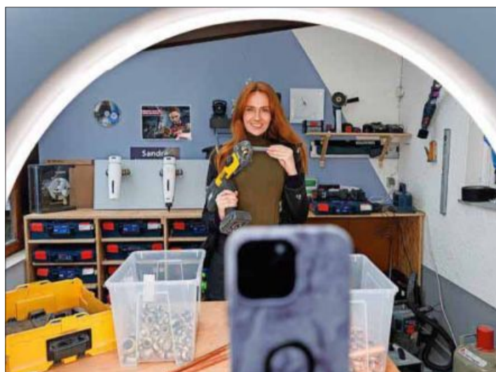
Auch die hauseigene Werkstatt ist Schauplatz der Drehs.