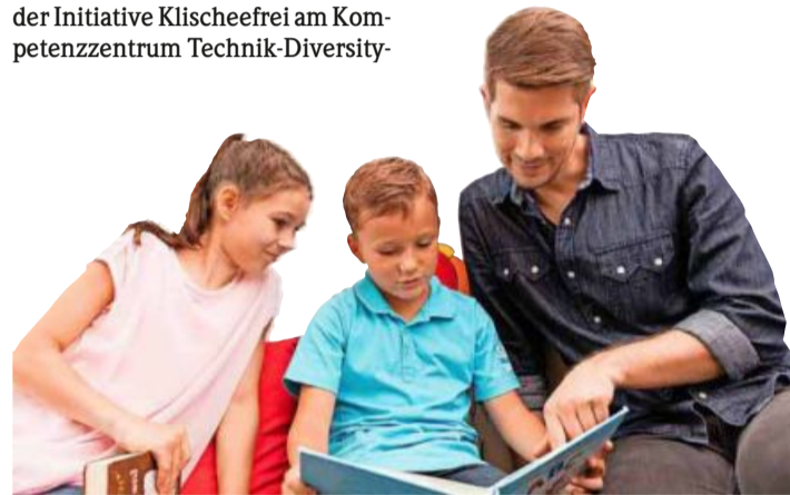
Männliche Azubis gibt es in Kitas eher selten.

In männlichen Erwerbsbiografien kommen zudem immer noch kaum Teilzeitarbeit oder Auszeiten für die Betreuung von Kindern, Alten und Kranken vor, bei Frauen dagegen umso mehr. Wir müssten daher nicht nur unsere Vorstellung von Führung überdenken, um Geschlechtergerechtigkeit zu erreichen, fordert Groß. Auch die Fürsorge und Pflege von Angehörigen müssten Männer und Frauen gleichmäßiger unter sich aufteilen. dpa, BZ