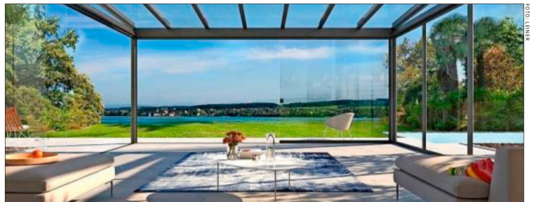
Macht das Leben draußen noch ein bisschen schöner: ein Terrassendach.

Mathis Sonnenschutz GmbH Ahrichstraße 8 79108 Freiburg ☎ 0761/132054 www.mathis-sonnenschutz.de