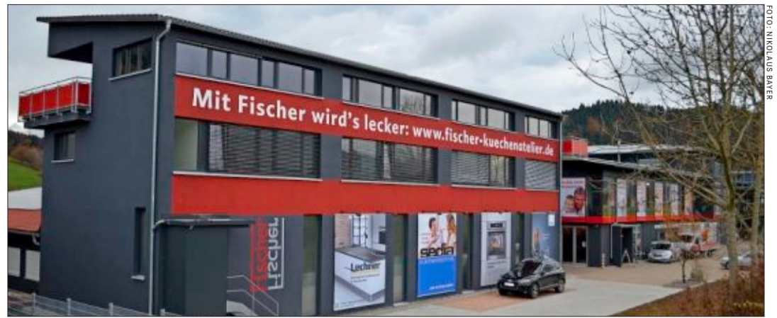
Von Gutach-Bleibach aus gehen Fischer-Küchen in die Region und in die Nachbarländer. Vertreten ist das Unternehmen auch im Industriegebiet Freiburg-Nord.

Seine Fischerküche erhält der Kunde stets aus einer Hand. Umgesetzt werden die Wünsche von Planern sowie qualifizierten Einbautechnikern. Dabei wird auf die richtige Ergonomie für kurze