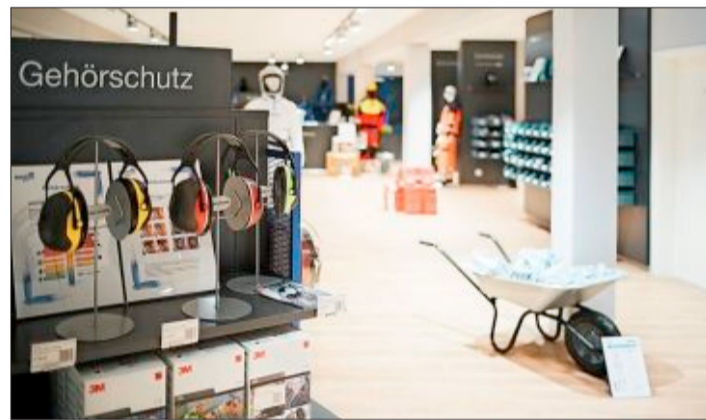
Im neuen Maertinturm an der Mooswaldallee kann das Unternehmen auf zwei Etagen sein Angebot modern präsentieren.

Maertin & Co. AG Mooswaldallee 12 79108 Freiburg ☎ 0761/514560 www.maertin-freiburg.de