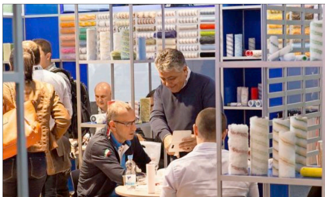
Auch das ist Wirtschaft im Freiburger Norden: Alle vier Jahre findet hier die Interbrush statt, die weltgrößte Fachmesse der Bürstenbranche.

Ihre Aufgabe als Plattform des Austauschs und auch als Sprachrohr wird von den Unternehmen positiv aufgenommen. Um die 150