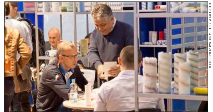
Bei der Interbrush, der weltweit größten Fachmesse für den Bürstenmarkt, werden in Freiburg rund 7500 Besucher erwartet.

Über die Entwicklungen auf dem Bürstenmarkt tauschen sich Fachleute alle vier Jahre bei der Interbrush in Freiburg aus. Die Fachmesse ist die weltweit führende der Branche. Maschinen, Material und Zubehör für Bürsten, Pinsel, Mopps oder Farbröller werden präsentiert, neue Techniken vorgestellt und Fragen von Experten beantwortet. Die von der Freiburg Wirtschaft Touristik und Messe GmbH & Co. KG (FWTM) organisierte Veranstaltung findet das nächste Mal vom 6. bis 8. Mai 2020 auf dem Freiburger Messegelände statt. Mehr als 200 Aussteller der Bürsten- und Pinselindustrie aus rund 30 Ländern stellen ihre Produkte vor.