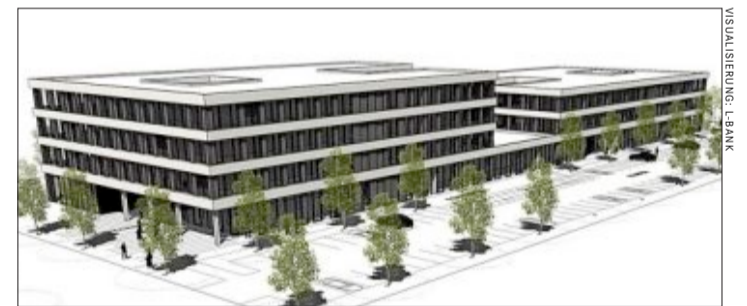
Das geplante Innovationszentrum Friz im Industriegebiet Nord

Freiburg Wirtschaftsimmobilien Neuer Messplatz 3 79108 Freiburg ☎ 0761/38811207 fwi-wirtschaftsimmobilien.de