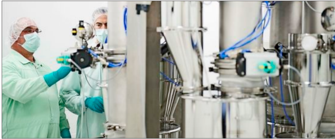
Die CMT-Anlage im Freiburger Pfizer Werk ermöglicht einen vollautomatischen Produktionsablauf. Dabei will das Unternehmen am Standort weiter wachsen.

Derzeit entsteht auf einer Grundfläche von rund 5000 Quadratmetern eine moderne Fertigungsstätte für feste, hochwirksame Arzneimittel. „Mit der neuen Produktionsanlage nach Ideen von Industrie 4.0 bauen wir unsere gute Position im internationalen Wettbewerb weiter aus. Wir investieren 140 Millionen Euro, um zukünftig in größeren Maßstäben Tabletten und Kapseln aus hochwirk-