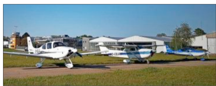
Der Fuhr- oder besser der Flugpark des Breisgauvereins für Motorflug

Der Breisgauverein für Motorflug (BVM) entstand aus dem 1907 gegründeten Breisgauverein für Luftfahrt als Sparte Motorflug, in dem auch die eigenständigen Sparten Fallschirmsport und Segelflug angegliedert sind. Mit viel Eigenleistung und Engagement der Mitglieder wurde 1966 die damals größte private Flugzeughalle mit einem eigenen Clubheim erstellt. Diese Baumaßnahme war die Basis für ein funktionierendes Vereinsleben und für die Unterbringung der vereinseigenen und privaten Flugzeuge. Viele Motorflieger kommen aus den Reihen der Segelflieger, aber auch aus der Begeisterung heraus und der Faszination am Fliegen. Für nicht wenige Mitglieder war der BVM das Sprungbrett für die Verkehrsfliegerei, etwa bei der Lufthansa oder Swiss. Die Mitglieder kommen aus allen gesellschaftlichen Schichten und befinden sich im Alter von 21 bis 97 Jahren. Dem BVM gehören heute drei Flugzeuge für die unterschiedli-