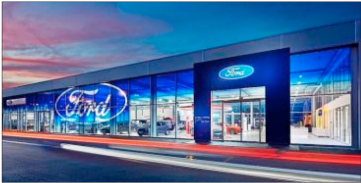
Im neuen Ambiente präsentiert sich Ernst + König an der Mooswaldallee und verknüpft hier Moderne mit Regionalität.