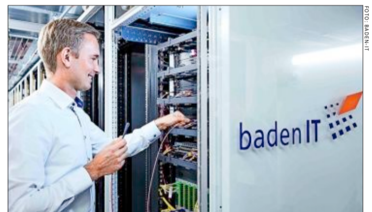
Mit stets aktuelle Technik sorgt Baden-IT für Datensicherheit.