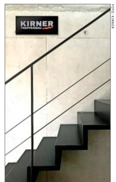
Fast industriell wirkende Treppen von Kirner liegen gerade im Trend.

Kirner Treppenbau e. K. Weißerlenstraße 1b 79108 Freiburg ☎ 0761/15615780 www.kirner-treppen.de