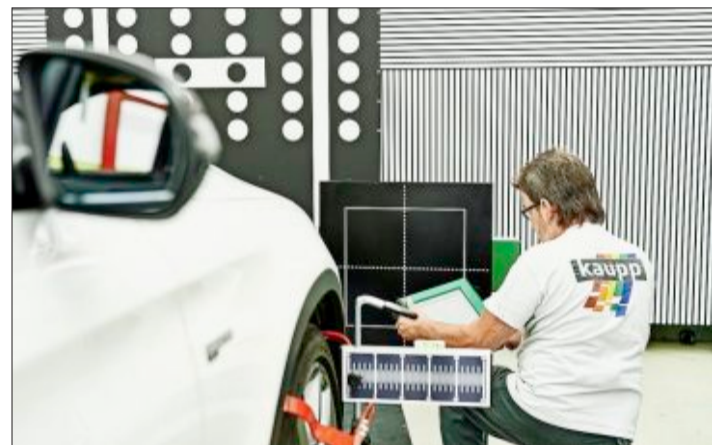
Blech- und Lackschäden haben bei Kaupp keine Chance.

Kaupp GmbH Karosserie- & Fahrzeuglackierzentrum Zinkmattenstraße 28 79108 Freiburg ☎ 0761/61167790 www.kaupp-gmbh.de