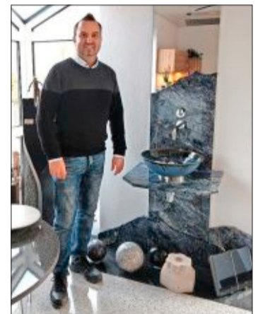
Auch im Innenbereich ist Luther Naturstein aktiv.

Luther Naturstein GmbH Blankreutestraße 21 79108 Freiburg ☎ 0761 / 132939 www.luther-naturstein.de