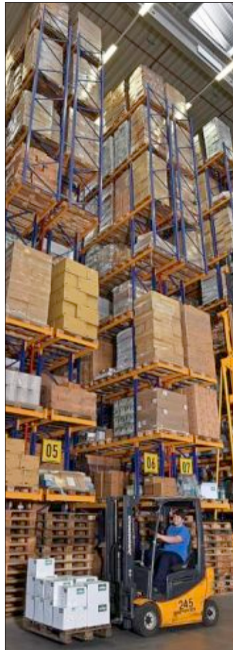
Streck transportiert alles, was auf eine Palette passt.

Der Dienstleister setzt sich zudem mit dem SC Freiburg in dessen Programm „Fair Ways – wir übernehmen Verantwortung“ für einen verantwortungsvollen Umgang mit vorhandenen Ressourcen ein. So unterstützt Streck auch in der aktuellen Bundesligasaison