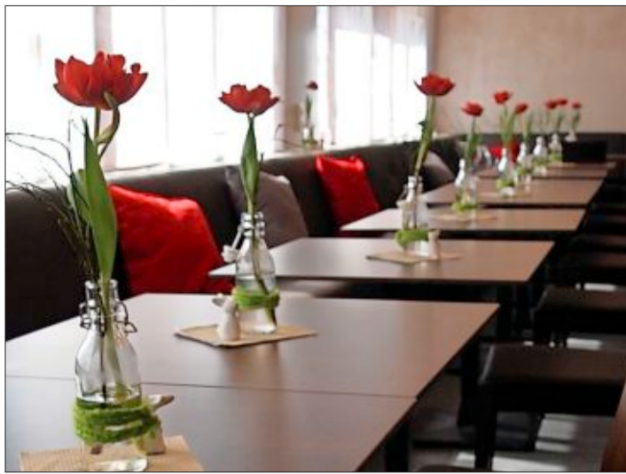
Die Kantine des Vita-Naturmarkts steht auch der Öffentlichkeit zur Verfügung.