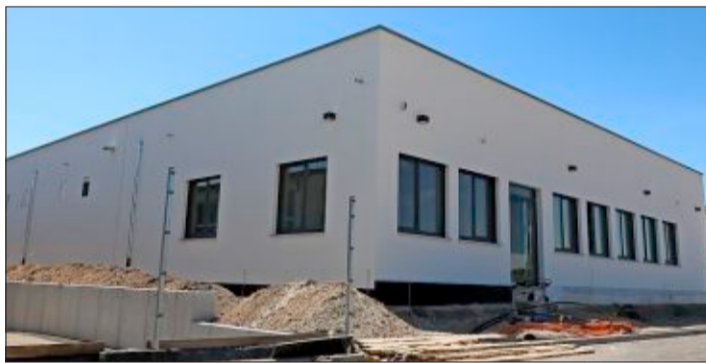
Der Rohbau des neuen Rechenzentrums der Leitwerk AG in Appenweier steht bereits.

Die Datenmenge, die täglich in Unternehmen verarbeitet wird, sorgt dafür, dass immer mehr mit-