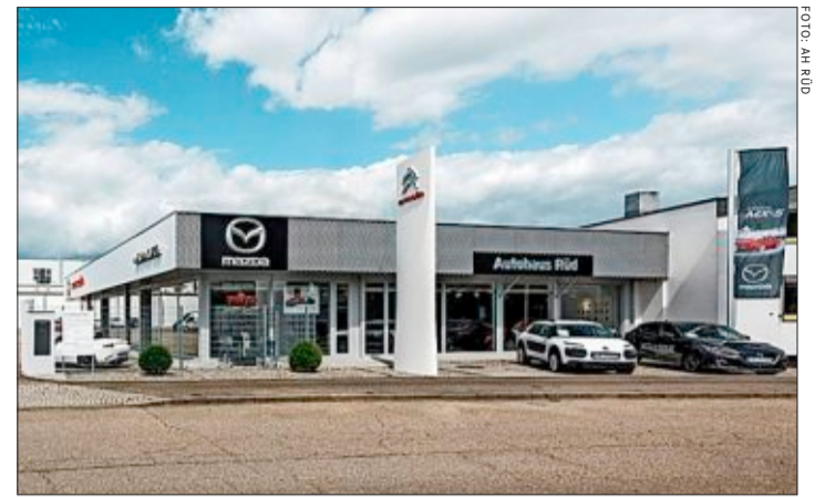
Das Autohaus Rüd, seit 1975 im Industriegebiet Freiburg-Nord ansässig, führt neben der Marke Citroën seit 2014 auch die japanische Marke Mazda.

„Mazda geht davon aus, dass die Elektromobilität für die Kurzstrecke