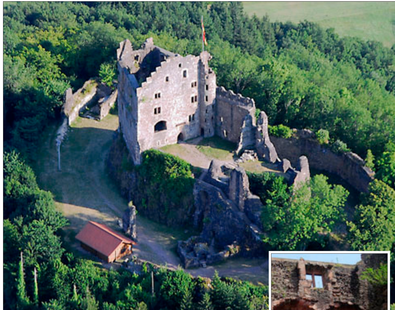
Hohengeroldseck ist immer noch eine mächtige Burg, obwohl sie schon zu Zeiten des Fürstentums eine Ruine war.