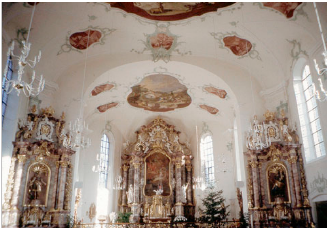
Der Altarraum der Kirche von Ettenheimmünster; unten der Herzog von Enghien